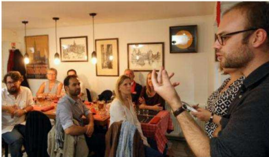
Un premier dîner littéraire avait été proposé l'an dernier.