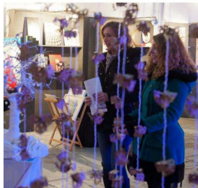
Deux des organisatrices de Fées d'hiver, expo artistique et artisanale de Colod'Art.

► QU'EST CE QUE Fées d'Hiver ? Un « marché de Noël réinterprété en exposition collective », en un lieu original, l'ancienne usine de couleurs Colod'Art, à la Meinau. Portée par le collectif Art Puissance Art, l'exposition collective est par choix entièrement féminine. Vingt-six femmes aux univers graphiques fort variés exposeront donc durant deux week-ends, à compter du 24 novembre, en ce beau lieu intemporel qu'est Colod'Art. Autre règle fondatrice des Fées d'Hiver : ceux et celles qui y recherchent des cadeaux trou-