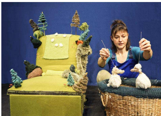
Comment résister à l'oppression quand on est un mouton ? Pas si facile... DOCUMENT REMIS

En plus des « Contes de la poche arrière de mon pantalon » proposés par Frédéric Duvaux dans la cour du FARSe, rue des Veaux, dimanche à 16 h, et des Weepers Circus dimanche à 12 h 30 dans cette même cour du « off », les 2-10 ans pourront découvrir six spectacles sur la presqu'île. Théâtre, musique et marionnettes sont au menu de « Nicolette et Aucassin, un sentier dans la ville », par la C e Atelier Mobile, à partir de six ans. Cette même compagnie n'oublie pas les tout-petits, à qui elle propose un parcours sensoriel dès neuf mois. Écologique, poétique et convivial, « Le manège des mille et une nuits » de la C e Atelier Mobile (dès 3 ans) tournera tous les jours. Mêlant musique et marionnettes, « Pas si bête-tes » (à partir de 4 ans) amènera vendredi et samedi Les Zanimos à s'interroger sur la meilleure façon de réagir à l'oppression quand on est un mouton. Fanny Delque proposera, trois jours