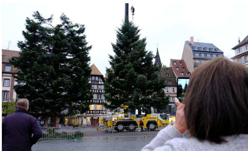
Des curieux ont assisté hier matin à la découpe du grand sapin de Noël fissuré sur la place Kléber, après en avoir chassé le « troll »...

Principe de précaution oblige, la Ville a procédé hier à l'abattage du 2 e sapin géant qui devait être le phare de Strasbourg capitale de Noël. Pour faire passer la pilule, la municipalité a déployé des trésors d'imagination pour faire de ce mauvais buzz un coup de com' plutôt réussi. Suite des aventures du grand sapin de Noël dimanche matin, avec l'arrivée du « plan C ».