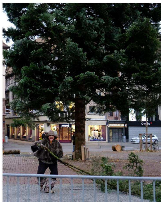
Précédant les tronçonneuses, le « vrai troll » qui habitait le sapin est venu défier les curieux, avant de prendre la fuite...

Les grandes branches ont ainsi été distribuées aux habitants entre midi et 14 h, pour en faire des couronnes de l'avent par exemple. Tout comme des « galettes » du tronc (avec un graff du troll) – « dont la malédiction a désor-