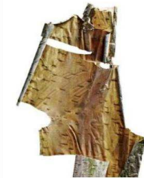
Stéphane Spach nous révèle la nature jusque dans ses retranchements intimes...