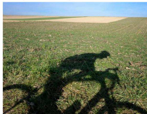
Une œuvre de Michel Friz.

Michel Friz, photographe cycliste, parcourt les routes et les chemins d'Alsace pour vivre le paysage de l'intérieur. Cette expérience sensible influence son regard et modifie son rapport avec le temps. Dans cette quête de nouveaux horizons et de rencontres imprévues, faire des détours