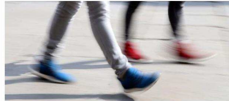
Une œuvre illustrant le thème du mouvement.

C'est le dernier jour de l'exposition « L'eau, le mouvement, les portes », montrant les photos des auditeurs du cours de photographie donné par Jacques Hampé,