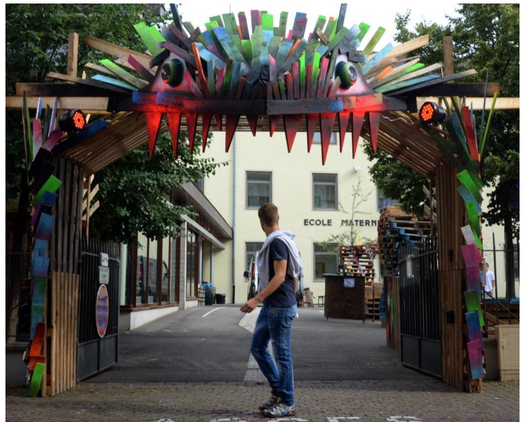
Il faut passer dans la gueule d'une créature fantasmagorique, imaginée et réalisée par l'association Art puissante Art, pour accéder au « village » du festival, dans la cour de l'école Pasteur, rue des Veaux.

- A 22h30 : Fous de bassin , spectacle sur l'eau, au bassin Austerlitz. Entrée du public place Dauphine, devant la Cité de la musique et de la danse. « Pièce d'eau » avec quin-